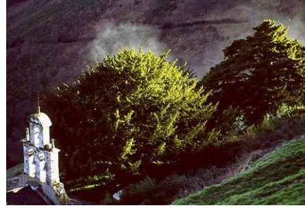
Tejo de Santa Coloma

Ésta es muy dura y compacta, de gran duración al ser imputrescible. El color de la albura es blanco marfil, siendo el duramen de color rojizo en el momento del corte y pardo rojizo una vez seco. Es muy estimada en ebanistería y fue utilizada en la antigüedad para la fabricación de arcos. Se usa en tornería, talla, en la elaboración de mangos de herramienta o utensilios de cocina.